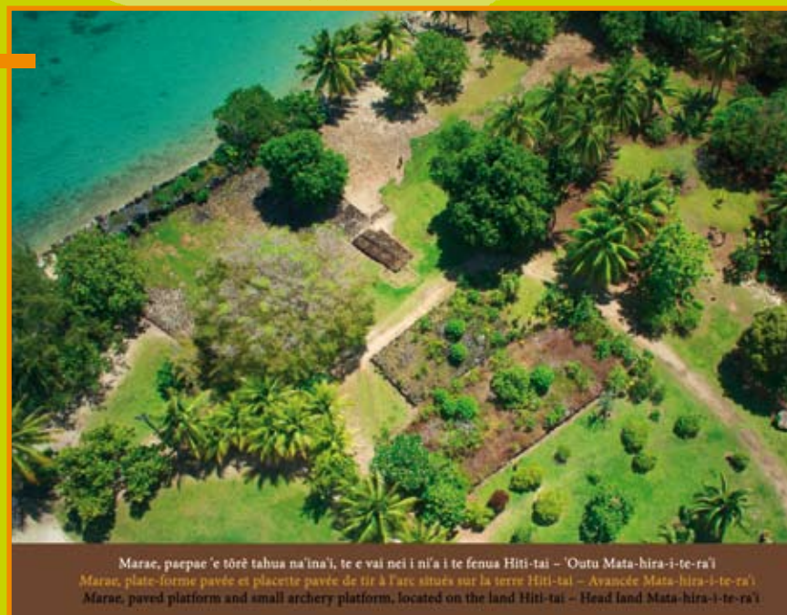
Marae, paepae 'e tōrē tahua na'ina'i, te e vai nei i ni'a i te fenua Hiti-tai – 'Oatu Mata-hira-i-te-ra'i Marae, plate-forme pavée et placette pavée de tir à l'arc situées sur la terre Hiti-tai – Avancée Mata-hira-i-te-ra'i Marae, paved platform and small archery platform, located on the land Hiti-tai – Head land Mata-hira-i-te-ra'i

HIRO'A JOURNAL D'INFORMATIONS CULTURELLES