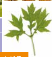
Pia Tahiti, hoho'a NMT.