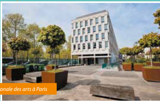
Cité internationale des arts à Paris

Destiné à soutenir et promouvoir les artistes du fenua, le ministère de la Culture a lancé un appel à candidatures pour le premier programme de résidences d'artistes. Ouvert par voie de concours aux détenteurs de la carte d'artiste professionnel, les quatre lauréats auront l'opportunité de partir en juillet pour une durée de trois à quatre mois à la Cité internationale des arts à Paris, le plus grand centre de résidences d'artistes au monde.