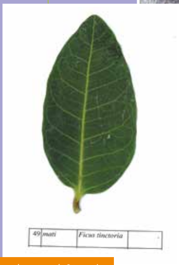
Te rau'ere e te mā'a ō te mati