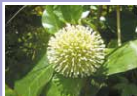
Mara Fleur Neonauclea fosteri