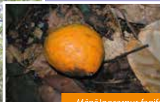
Māpē Inocarpus fagifer fruit mūr

Māpē, Inocarpus fagifer châtaigner tahitien , Tahitian chestnut,