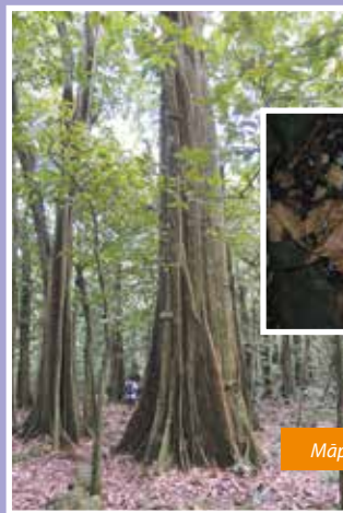
Māpē géant

E tumu rā'au rarahi mau e te auhia, 'oia ho'i nō te tarai i te va'a (Te 'ā'ai ō Rātā, e 'aito huaira).