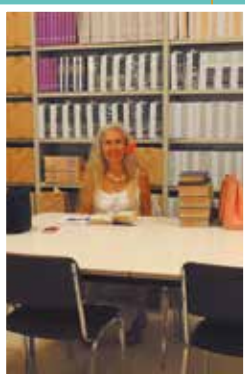
Salle de consultation publique du SPAA, septembre 2018. Les églises et les collectionneurs privés contribuent aussi à la sauvegarde de savoirs polynésiens anciens.