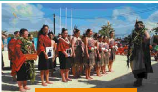
Présentation de la délégation d'Aotearoa