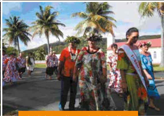
Arrivée du tāvana Uturoa et des miss Raro Mata'i

Initié en 1995, après la rencontre des pirogues océaniques « A fano ra », aussi appelé « l'Alliance amicale » à Taputapuātea, le Festival Taputapuātea - Triangle Polynésien « Te Ana Iva Pu Fee Tere Moana » (Les huit tentacules de la pieuvre qui glisse sur l'océan), a été organisé du 8 au 12 juillet dernier par l'association Raiatea Nui, sur l'île de Ra'iātea, pour sa 9 e édition.