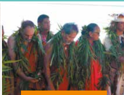
Moment solennel à Taura'a Tapu