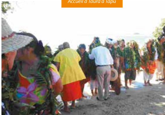
Accueil à Taura'a Tapu