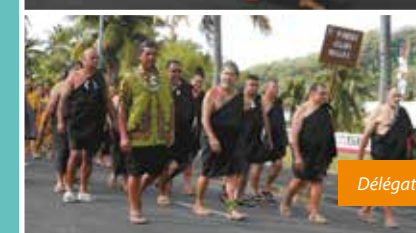
Délégation Pakui Alua - Hawaii