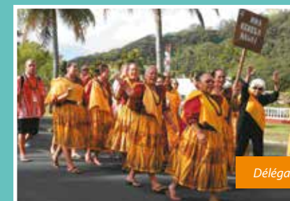
Délégation Kekela Hawaii

Le programme du 9 e Festival Taputapuātea a conduit les délégations dans les districts de Ra'iātea et Taha'a, pour découvrir des lieux et vestiges historiques de Raro mata'i. Les festivités se sont déroulées tout au long de cette semaine de juillet, sur fond de danses et chants traditionnels, de jeux anciens. Au-delà de la valeur culturelle forte de cette rencontre, les liens fraternels ont été scellés encore plus étroitement et plus fortement, donnant à chacun la hâte de se retrouver au prochain Festival Taputapuātea - Triangle Polynésien « Te Ana Iva Pu Fee Tere Moana », en 2021 à Rapa Nui. ♦