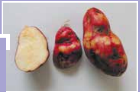
Ipomoea batatas patate douce, Sweet potato, POL

'O « Hātua-ō-Rogorogo » te tahi i'oa nō te 'ūmara ; nō te mea, i roto i te tahi fa'ati'ara'a 'ā'ai, nā te vāhine ra ā Turi i hōpoi atu i te 'ūmara i roto i tō na hātua, 'ia vai tāpīri noa i tō na tino 'ei tāmahanahana ra'a iā na (Buck, 1953:253).