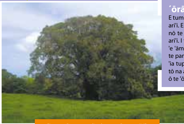
Ficus prolixa var. prolixa banyan, Banyan, IND

Teie te tahi nau rā'au e tupu nei nā ni'a i nā 'e'a to'ō piti nō 'Ōpūnohu i Mo'orea- Te-ara-tupuna 'e Te-'e'a-nō-te-'āro'a-Pu'uroa - tei fāna'ō i te tahi mau paruai fa'a 'ite 'itera'a i tō rātou fa'a' ohipara'a i roto i te orara'a ā te Mā'ohi, i te mātāmua ihoā rā.