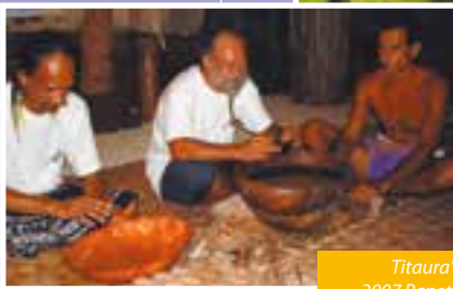
Titaura'a i te 'ava 2007 Papeto'ai, Mo'orea.

Eravehia te a'a ōteierā'au nō te fa'aineinera'a i te tahi inu mō'a, ta'a ē, tē pūpūhia i te tau heiva 'e i te 'oro'a marae ihoā rā i mūta'a ra ; nā te tāne ana'e i Pōrīnētia tā'ato'a e inu (maoti i te fenua Aotearoa, Rapa iti e Rapa Nui). E mamahia te a'a, 'a tūtuha atu ai i roto i te tahi 'umete ; 'e 'ia hōpue, e riro ia 'ei 'ava fa'aunuhira'a vārua 'aore rā fa'a'aitoitorā tino. Te fa'aora-fa'ahou-hia nei te 'oro'a nō te 'ava, 'e i teie tau, e fa'ainu-ato'a-hia te vāhine tia'ara'a mana, i te tau heiva ānei 'aore ia i te mau 'oro'a mana fāfaura'a. E pape inu ho'i te 'ava nō te mau mahana ato'a i te mau fenua Fitī, Vānuatū, Hāmoa 'e i Mērānētia. 'Ua riro te ota a'a pūehu nō te 'ava i te 'āno'ihia i te pape hā'ari 'aore rā i te pape mā'ohi nō te rā'au tahiti (G. Cuzent, 1940 ; Richard Rossile, 1986). I te fenua Peretiria (Brésil), i te taima 'a ravehia ai te 'oro'a nō te cahoïn (kava ?), e tūtuha te mau pōtī'i hinepōtea i roto i te tahi pāni nō te fa'amā'aro i te mā'a tō pāpā'a tei tūpa'ipa'ihia (Levy Strauss, 1961).