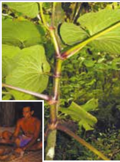
'AVA'AVA-I-RA'I Macropiper latifolium , plante, False kava, IND