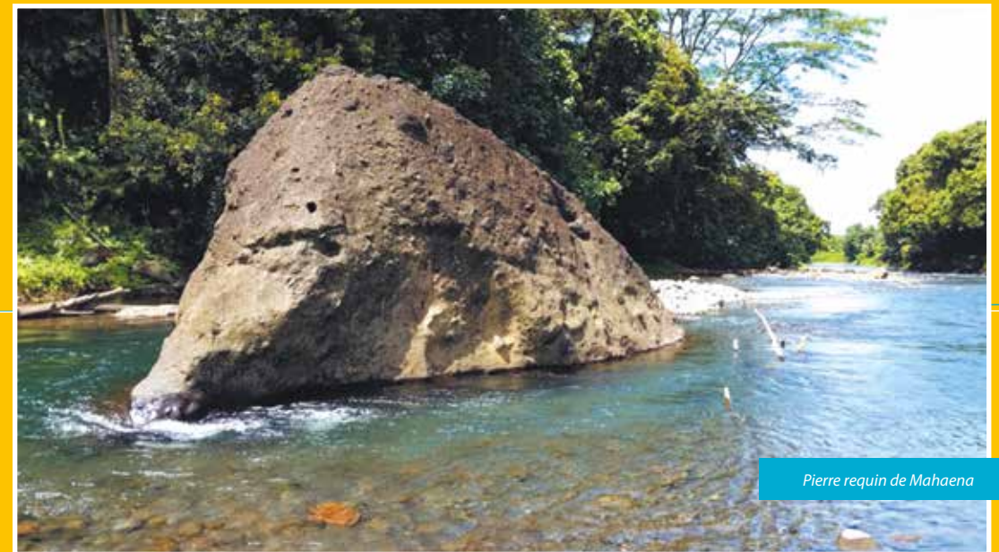
Pierre requin de Mahaena

a l'apparence d'un chien assis sur ses pattes arrière, la gueule relevée. De face, la partie basse laisse imaginer les deux pattes avant. De son promontoire, le chien observe le site culturel. Plusieurs versions existent sur le chien Pi'ihoro . Selon Elisabeta Puna'a, de Opoa, certains soirs, lorsque les habitants traversaient le site religieux pour se rendre au temple, ils apercevaient le chien sur le rocher. Après chaque apparition du chien protecteur un événement se produisait sur un des marae de Taputapuātea.