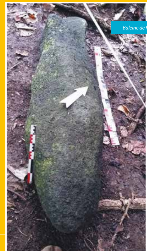
Baleine de Raiatea

Dauphin explique que l'empreinte du pied est un des symboles du lancement des cordes pour attraper le soleil : « Le bol creusé dans le rocher, était rempli d'eau pour éteindre sa soif. » La deuxième empreinte de pied a été localisée dans le lagon. Elle est matérialisée par un pâtre de corail qui a la forme d'un pied (approximativement 80 m de long et 50 m de large). Au Pk 11,150, côté montagne, un rocher a été identifié. Il s'agirait du rocher qui a servi à Maui pour attacher le soleil. Une première corde réalisée à partir des cheveux de Hina a été fixée à Mahaena, la seconde sur un rocher de Vairao. Disséminées dans toute la Polynésie, ces pierres lithiques à valeur légendaire sont la preuve des liens et des échanges qui existaient entre les différentes îles. ♦