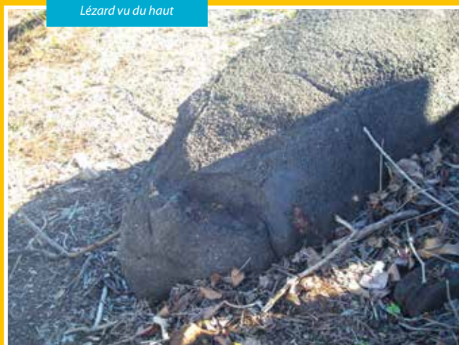
Lézard vu du haut