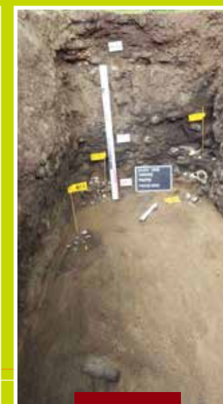
Site de fouilles